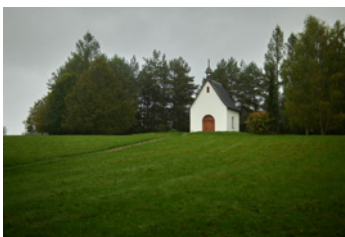
Schönstattská kaple Rokole v Orlických horách

ať se nedopustíš zlého.“ Tyto myšlenky mne napadají při vstupu do kostela sv. Martina, myslím na tichost a klid v okamžicích bezpráví a nespravedlnosti. Neměla by nás ovládnout beznaděj a bezmoc. Kristova tichost bere na sebe kříž a jde mu vstříc.