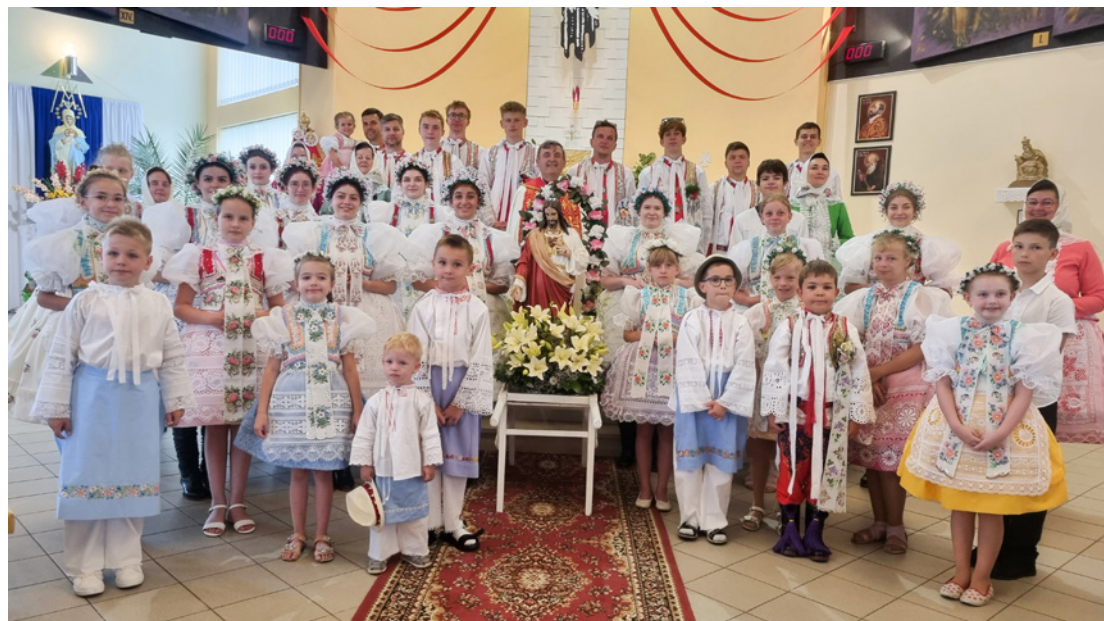
Slavnost Nejsvětějšího srdce Ježíšova