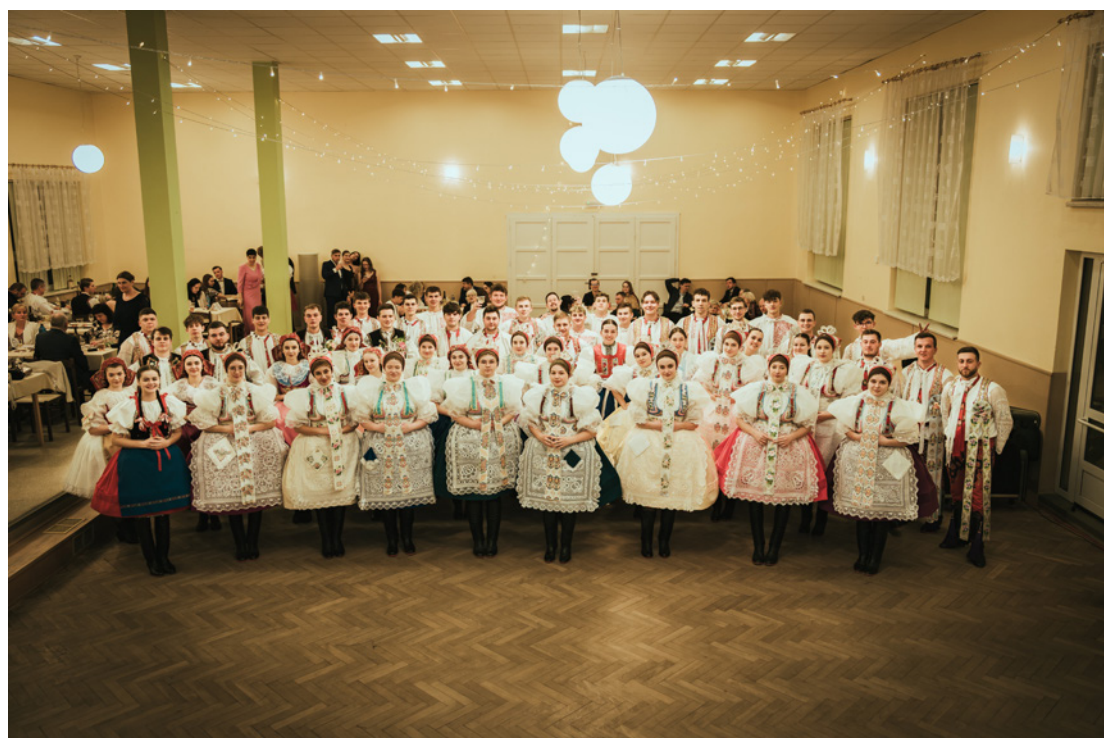
Krojový ples 2025