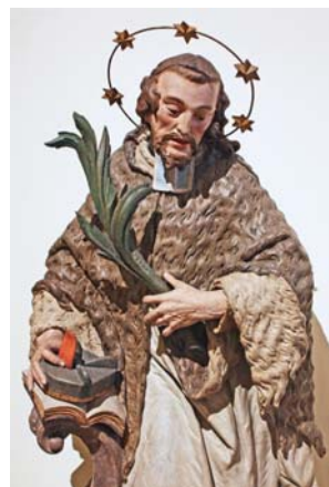
Socha sv. Jana Nepomuckého, Bayerisches Nationalmuseum, Mnichov

v Praze a později také nejprestižnější právnickou univerzitu v italské Padově. Po návratu do Prahy zastával v církvi několik funkcí a v roce 1389 byl jmenován generálním vikářem pražské arcidiecéze, což znamenalo, že fakticky vedl celou diecézi. Mnoho o jeho životě nevíme, což zavdalo vzniku legendy o příčině jeho mučednické smrti. Dlouho tradovaný příběh vypráví o Janovi jako důvěrném zpovědníkově manželky krále Václava IV., královny Žofie. Václav zatoužil poznat tajemství své manželky, ale Jan mu je odmítl vyrazdit. To rozlítlo panovníka natolik, že nechal kněze mučit, a když ani poté tajemství královny nevyzradil, nechal jej popravit. Ve skutečnosti se však Jan stal nejspíše obětí bojů o vliv mezi panovníkem a pražským arcibiskupem Janem z Jenštejna, kterého král jako svého neúnavného kritika nenáviděl. Václav chtěl omezit vliv pražského arcibiskupa tím, že vytvoří v Čechách nové biskupství, kam by dosadil některého ze svých oblíbenců. Potřeboval však k tomu značný majetek a pozemky, které by nové biskupství živily. Pro tento svůj plán si vybral bohatý Kladrubský klášter v západních Čechách, který vedl staříčský opat. Václav IV. doslova čekal na smrt tohoto duchovního.