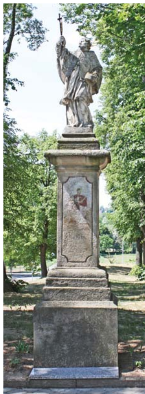
Socha sv. Jana Nepomuckého, prostranství před hřbitovem, Starý Poddvorov

dokázaly, že Janovi bylo uštědřeno hned několik kopanců a silných ran. Tak silných, že mu praskla lebka. Aby se Václav nedostal do opletaček s církevním právem, nechal Janovo tělo svázat do pytle a hodit do Vltavy z Karlova mostu. Podle středověkého práva bylo totiž jediným oficiálním způsobem jak popravít kněze utopení. Jan byl však při vhození do řeky už mrtvý.