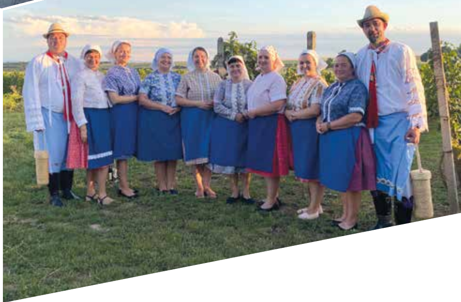
Foto přední strany obálky: Poděkování za úrodu v kostele sv. Martina Foto zadní strany obálky: 1. Biřmovanci na pěší pouti do Žarošic 2. Sbor Potvoráci jací tačí na Zarážání hory

Zpravodaj vydává Obec Starý Poddvorov, 696 16 Starý Poddvorov Povoleno MKČR E 12424